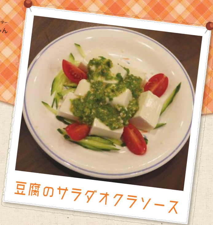
豆腐のサラダオクラソース