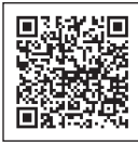
草津線沿線に高専を誘致する会の情報はこちら

滋賀県では県内で初めてとなる高等専門学校(高専)の設置に向けた構想骨子を令和3年度に取りまとめました。高専誘致に対して市では湖南市議会の決議などを受け、甲賀市とともに甲賀地域への設置を滋賀県知事に要望しています。高専は産業の様々な分野で活躍できる技術者を育てるため、中学校を卒業した生徒が5年間で専門知識を習得する高等教育機関です。県内に設置されることで子どもたちの進路の選択肢が広がることや地域への通学による賑わいと活性化が期待されます。また、この誘致への取組には、湖南市・甲賀市の産業界の賛同企業で「草津線沿線に高専を誘致する会」なども設立されています。市民の皆さんもこの取組の応援をお願いします。