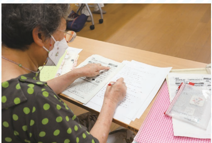
▲点訳のチェック 膨大な量です