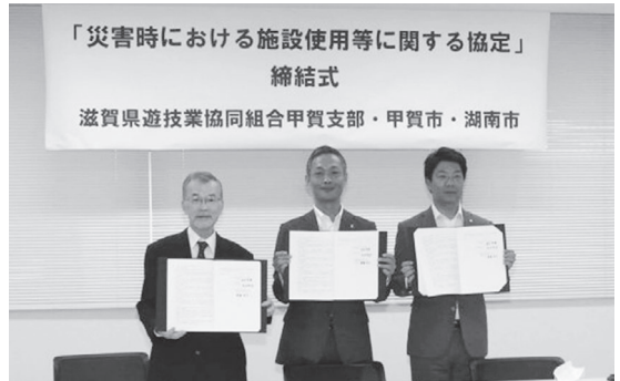
▲滋賀県遊技業協同組合甲賀支部様との協定締結式

10月17日、滋賀県遊技業協同組合甲賀支部様と「災害時における施設使用等に関する協定」を締結しました。この協定は、市内で災害が発生し多数の避難者が見込まれる場合、市からの要請に基づき、組合加盟パチンコ店の駐車場を避難場所として提供していただくもので、車中泊、テント泊など多様な避難先を確保するという観点から締結しました。今後はこの協定に基づき、相互の連絡体制を整備し、災害に備えます。