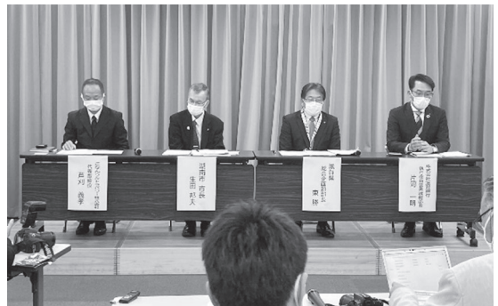
▲県庁での記者会見