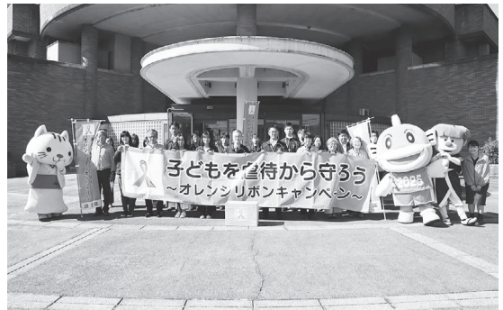
▲児童虐待防止キャラバン隊の皆さんと市職員

キャラバン隊の代表者より、「児童虐待は、子どもの人権を著しく侵害し、子どもの将来に大きな影響を与えるため、要保護児童対策地域協議会を中心に子どもを虐待から守るネットワークの一層の充実を図りたい」とのメッセージや啓発用ティッシュを市長に手交いただきました。