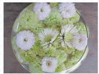
▲バラ・菊などの花手水(1月) ▲菊の手水鉢(12月)