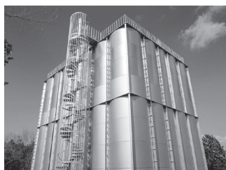
▲ワンワン山配水池

水道水は、毎日、色度・濁度・残留塩素など必要な項目について検査するほか、定期的に市内各所のじゃ口から採った水道水を検査しています。