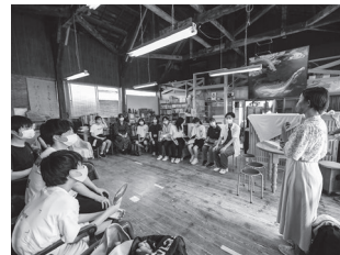
こなんSDGsカレッジ2022の様子