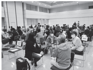
まちづくりフォーラムの様子

こなんSDGsカレッジ2023はまもなくスタートします。興味がある中学生・高校生・大学生、保護者の皆さんはいつでもお気軽に☎までご連絡ください。