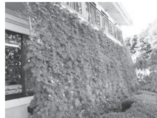
石部南まちづくりセンター