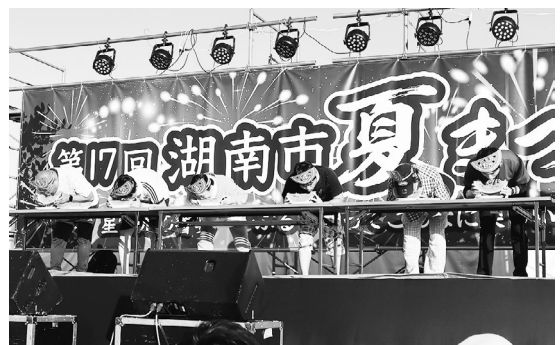
▲大栄スイカ早食い競争 決勝の様子

フィナーレの花火大会では小型煙火を含む約3000発の花火が夜空に上がり、多くの来場者からの拍手や歓声で会場が一体になりました。