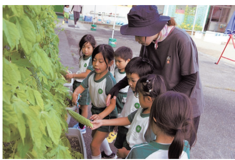
「ゴーヤ食べたら、どこが強くなるかな？」

給食の時間に「この食べ物を食べたら、体のどこが強くなるのかな？」と、子どもたちとよく話しています。 Aくん 「きのこが入ってる。きのこ食べたら、どこが強くなるのかなあ？」 Bちゃん 「どこやろう？」 Cくん 「わかった!! 頭が大きくなるんちゃう？」 それを聞いて、クラスのみんなで大笑いしました。