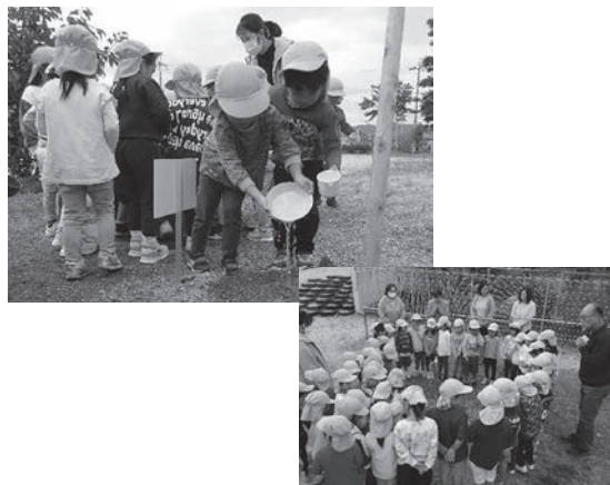
▲阿星あかつき保育園の皆さん

今後は被爆アオギリを大切に育てるとともに、こどもたちと一緒に原爆や戦争について考えるきっかけにします。 ※広島や長崎で被爆した親木からできた種子や苗木を育てて成長した次世代の樹木