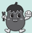
湖南省健康づくりキャラクター 湖なすちゃん