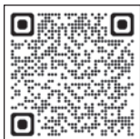
十二坊温泉ゆらら ホームページ