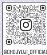
@CHOJYUJI_OFFICIAL 国宝 長壽寺 Instagram

問 (一社)湖南省観光協会 TEL0748-71-2157 FAX0748-72-9622