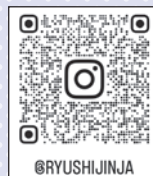
@RYUSHIJINJA 立志神社 Instagram