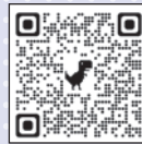
(一社)湖南省観光協会 ホームページ