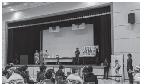
▲令和7年度の実行委員企画の様子

■対象 平成18年(2006年)4月2日～平成19年(2007年)4月1日に生まれた人