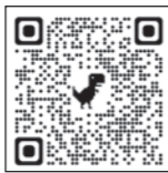
公益財団法人 滋賀県国際協会