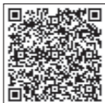
琵琶湖河川事務所 ホームページ