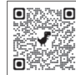
滋賀県立琵琶湖文化館 ホームページ

※要事前申込 ☎生涯学習課(西庁舎) TEL0748-77-6250 FAX0748-77-6253