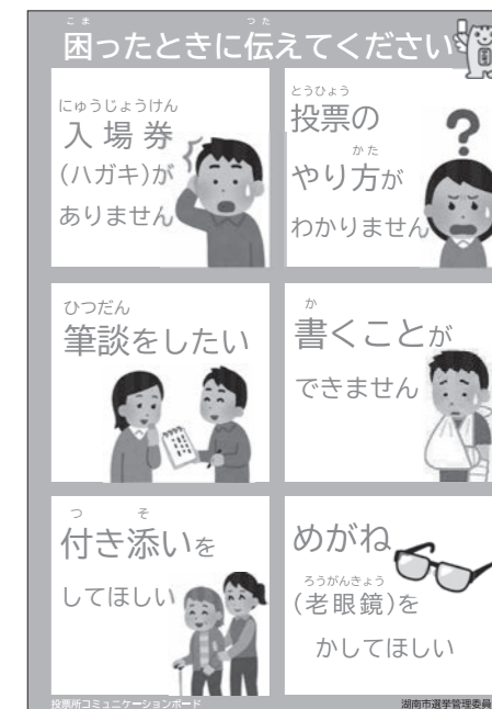
▲(参考)コミュニケーションボード

投票所でよくある問い合わせをイラストと簡単な文で表したものです。絵や文字を指差すことで自分の意思を伝えることができます。各投票所に設置しておりますので、お気軽にご利用ください。