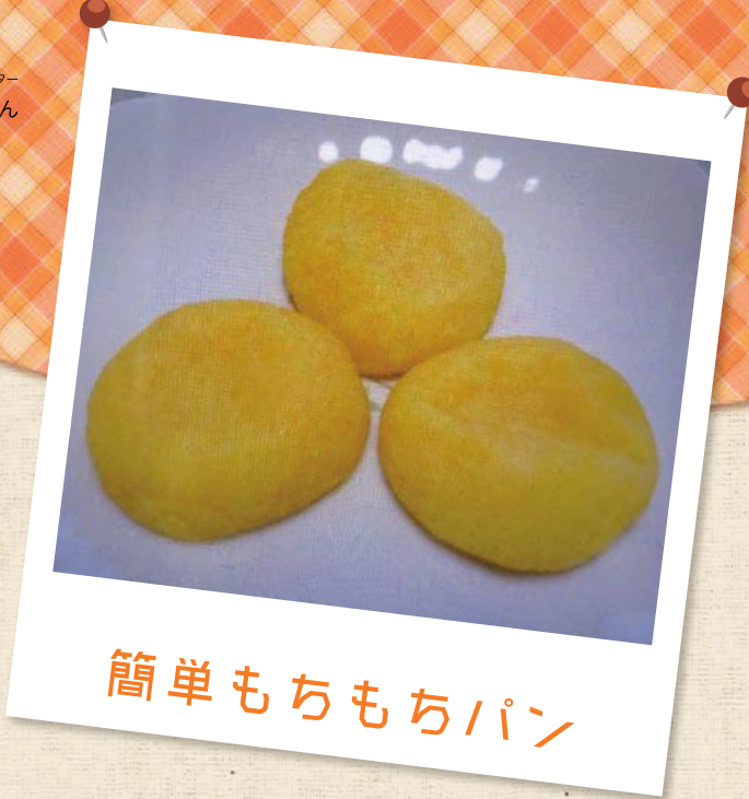
簡単もちもちパン