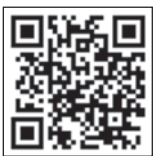
ホームページ 三幸・スポーツマックス 共同事業体