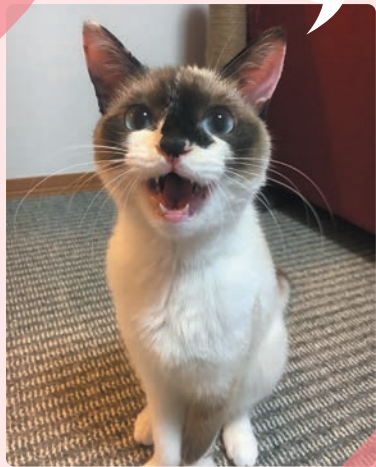
禮田 みーこちゃん 10歳

我が家に来て約6年、ちくわが大好きで一度も病気や怪我も無く元気に走り回っています。いつも目覚ましが鳴る前に肉球で顔をチョンチョンして起こしに来ます。