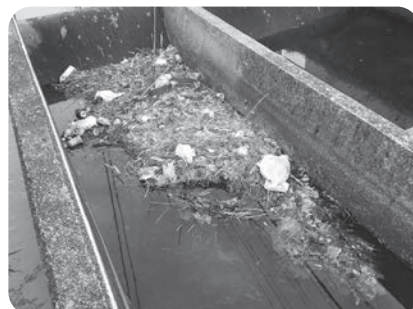
水路に詰まった刈草