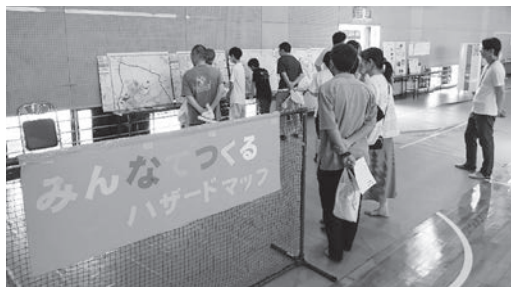
▲甲西北中学校防災フェスタの様子

この機会に、防災について改めて考え、いざという時の行動について確認しておきましょう。