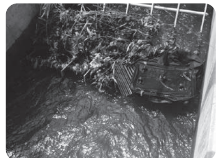
水路に投棄された靴