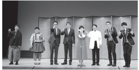
▲NHK上方演芸会の様子