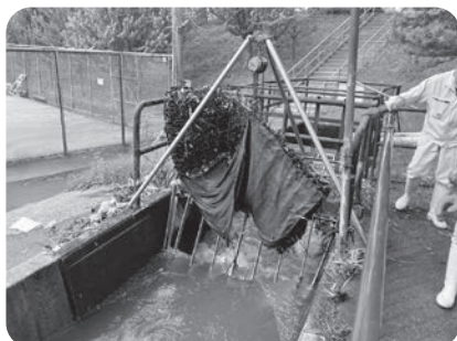
水路に破棄された粗大ごみなど

水路付近は大変危険が伴います。特に台風や急な大雨が降った時には、増水の危険もありますので、安全のため、水路には近づかないようお願いします。