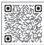
Instagram 三幸・スポーツマックス 共同事業体

☎三幸・スポーツマックス共同事業体 (湖南省総合体育館内) TEL0748-72-4990 FAX0748-72-7117