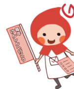
Mascote de saúde de Shiga Ken "Kumi chan"

Para maiores detalhes, veja o informativo do Centro de Saúde.