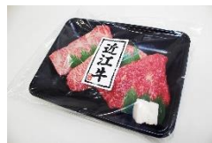
Variedade de três tipos de carne omi