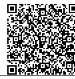
Clique aqui para mais detalhes

Informações: Seção de promoção do desenvolvimento local prédio "Higashi Chousha" TEL:0748-71-2316 FAX:0748-72-2000