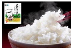
Arroz omi konyan