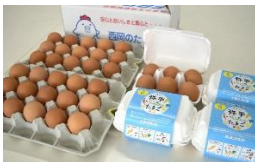
Ovos de Momiji & Ovos de Hiragai

Se você tiver alguma dúvida, não hesite em nos contatar.