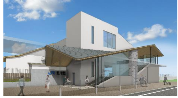
いしべ えき きたぐち かんせい よそう ず 石部 駅 北口 完成 予想 図

と あ さき とし せいさく か ひがし ちょうしゃ 問い合わせ 先: 都市 政策 課 [東 庁舎]