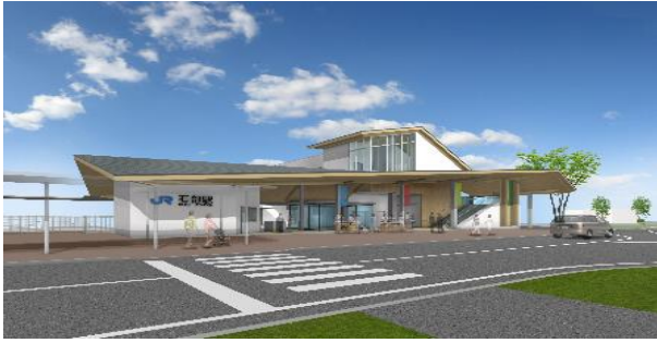
いしべ えき みなみぐち かんせい よそう ず 石部 駅 南口 完成 予想 図