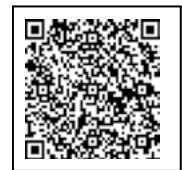
滋賀県 しがけん ホームページ

https://www.pref.shiga.lg.jp/ippan/kenkouiryouhukushi/yakuuzi/320755.html