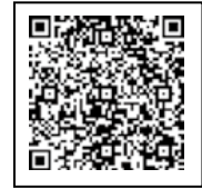
市 し ホームページ

手続き てつづ の 方法 ほうほう は 市 し ホームページ み を 見て み ください。