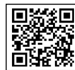
ficha de reserva

Informações: Seção de Política de Saúde (dentro do Centro de Saúde em Natsumi)