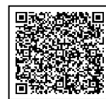
Homepage da cidade