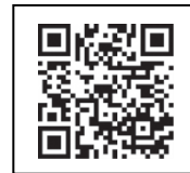
せつしゆ けん はっこう 接種券 発行 QR コード

ついか せつしゆ ひと せつしゆ けん ひと した と あ さき 追加 接種 を したい 人・接種券 が ない 人は 下の QR コード か、 問い合わせ 先 から せつしゆ けん はっこう しんせい 接種券 発行 の 申請 を してください。