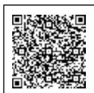
Homepage da cidade

Informações: Seção de Assuntos do Cidadão, edifício leste "higashi chousha" TEL: 0748-71-2323 FAX: 0748-72-2460