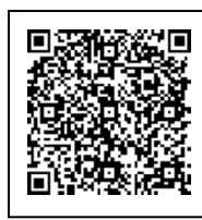
し 市 ホームページ

と あ さき こなんし しんがた せつしゅ 問い合わせ 先：湖南市 新型 コロナウイルス ワクチン 接種 コールセンター