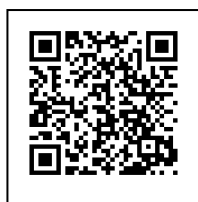
こうせい ろうどうしょう 厚生 労働省 ホームページ

せつしゅ きぼう ひと かぶ たいおう う ひと はや 接種 を 希望 する 人 で、オミクロン株 対応 ワクチン を 打っていない 人は 早め の せつしゅ かんが しない いりょう きかん せつしゅ う こなんし 接種 を 考えて ください。市内 の 医療 機関 で 接種 を 受けられます ので、湖南市 よやく システム から 会場 を 確認 して ください。また、しんがた さいしん 予約 システム から 会場 を 確認 して ください。また、新型 コロナワクチン の 最新 の じょうほう こうせい ろうどうしょう しんがた 情報 は、厚生 労働省 ホームページ の「新型 コロナ ワクチン について」の ページ を み 見て ください。