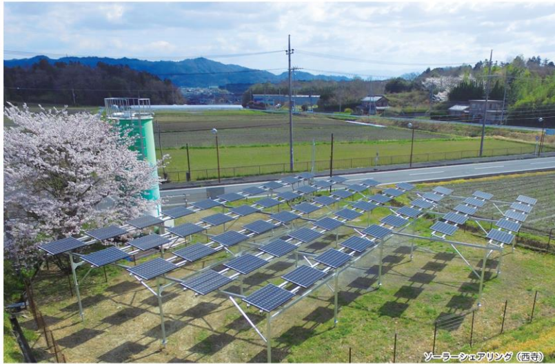
ソーラーシェアリング (西寺)