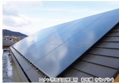
コナン市民共同発電所 初号機 (ハンパン)