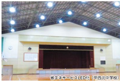
省エネサービスLED化 (甲西北中学校)