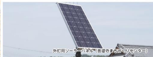
外灯用ソーラーパネル (菩提寺まほろびセンター)