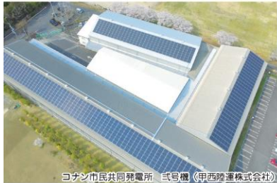
コナン市民共同発電所 式号機 (甲西陸運株式会社)

広報こなんポルトガル語版 2023年6月号 traduzido e emitido pela Seção de Direitos Humanos da Prefeitura de Konan Local : prédio "higashi chousha" tel : 0748-71-2354 fax: 0748-72-3788 Endereço: Shiga-ken Konan-shi Chuou 1-1