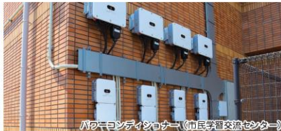
パワエコシティコナノ (市民学習交流センター)