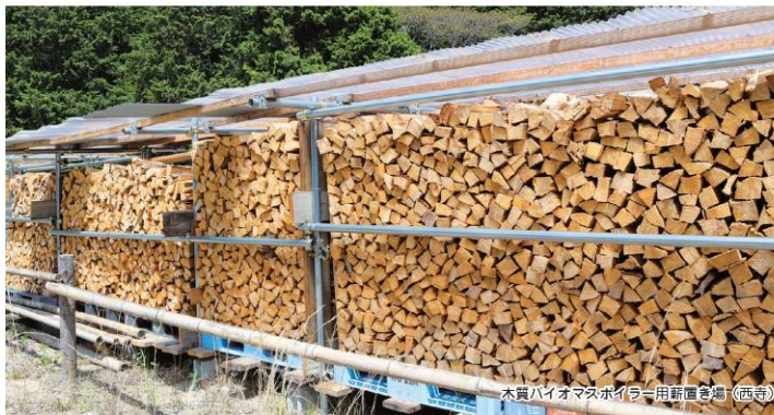
木質バイオマスボイラー用薪置き場 (西寺)