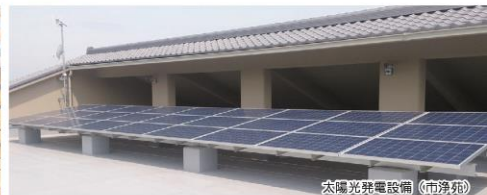
太陽光発電設備 (市湯苑)