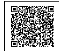
Homepage da cidade

Por favor, verifique o site da cidade para obter detalhes.