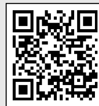
Formulário de inscrição

■ Método de inscrição: inscreva-se por telefone ou online pelo código QR ao lado.