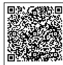
Homepage da cidade

Observe que não forneceremos respostas individuais às opiniões expressas.