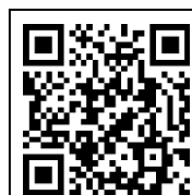
Formulário de inscrição

Informações: Seção de Políticas para Infância e Juventude (Centro de Saúde de Ishibe)