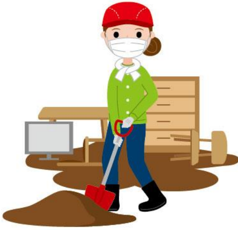
04_1防災ボランティア女性