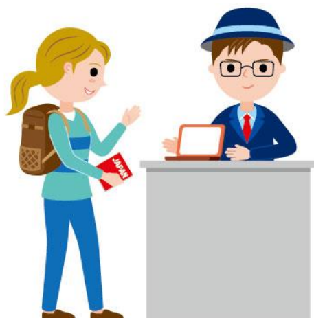
11_1外国人向け観光案内男性