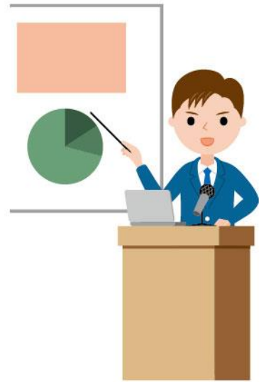
19_1演台に立つ人男性