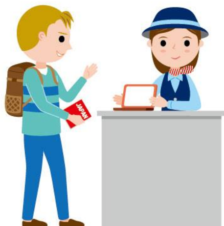
11_1外国人向け観光案内女性