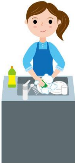
21_2食事の片付け女性