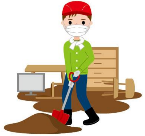
04_1防災ボランティア男性