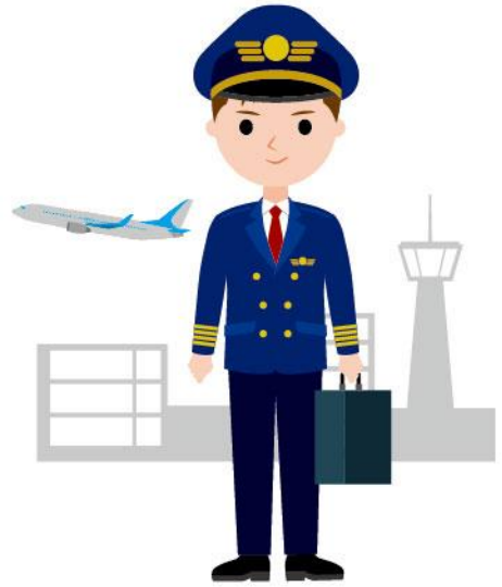
03_1飛行機のパイロット女性 03_1飛行機のパイロット男性