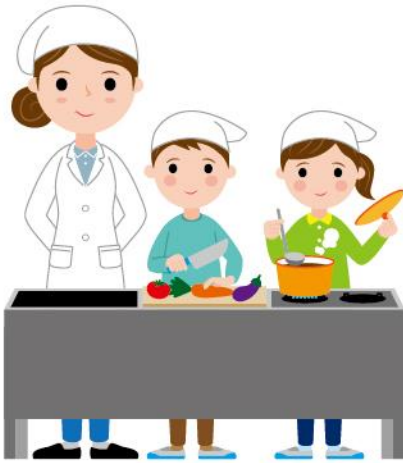
17_1家庭科の調理実習女性