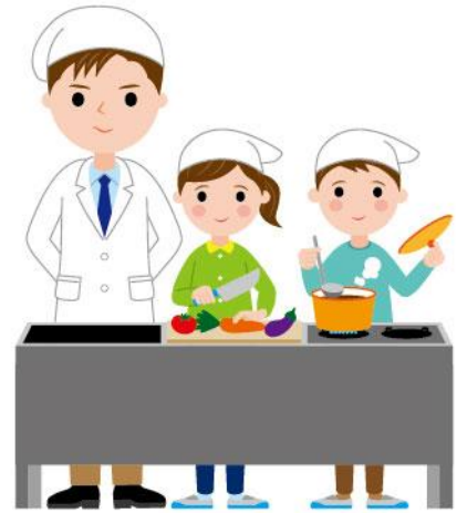
17_1家庭科の調理実習男性