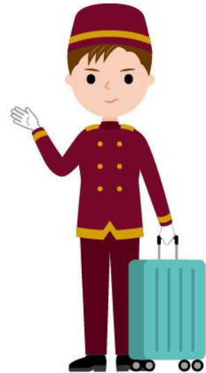
12_1ホテル従業員男性