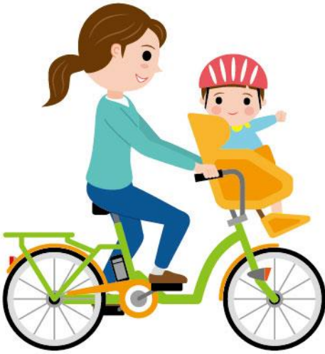
23_2乳幼児の送迎女性