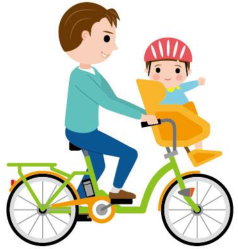
23_2乳幼児の送迎男性