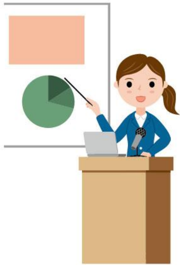
19_1演台に立つ人女性