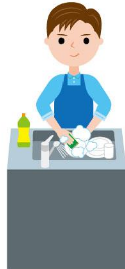
21_2食事の片付け男性