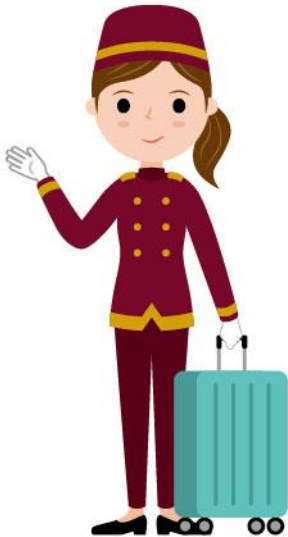
12_1ホテル従業員女性