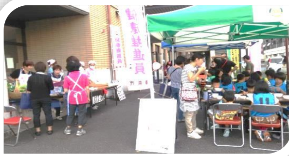
（ 健康まつり ）