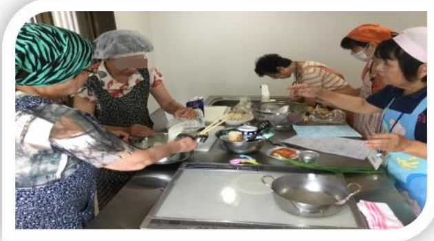
（ 地域での健康料理 ）