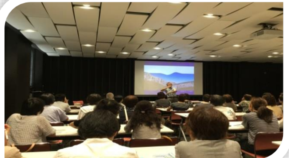
（ 健康推進員の研修の様態 ）