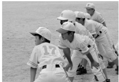
▲スポーツ少年団(子どものスポーツ機会の充実)