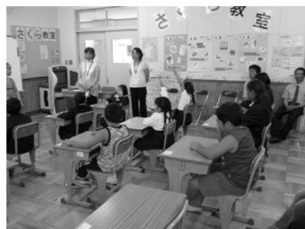
▲さくら教室(外国人児童生徒への学習支援)