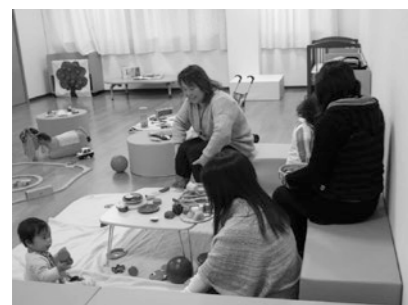
▲親子プレイステーション事業 (子育てに関する親の不安や悩みを解消する場の確保)