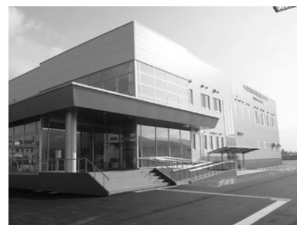
▲新しい学校給食センター (学校給食の充実)