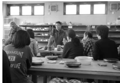
▲市民生涯学習講座 (地域に密着した学習機会の提供と地域の文化・人材の活用)