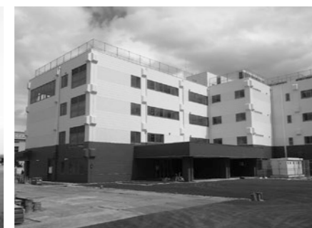
▲石部小学校新校舎 (学校施設の環境整備)