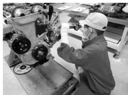
▲中学校での職場体験学習 (キャリア教育の推進)