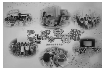
▲音読集「ことばの宝宝箱」 (語彙の量と言語の質を高める取り組み)