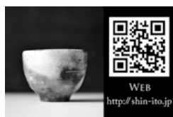
いぐち まさふみ 井口 雅文

湖南省産原料などを利用した独自の陶芸ブランドを開発しています。日常を少し特別にする器が目標です。また、デザイナーとして「ここぴあ」のグラフィックデザインに携わるなど、ロゴ・キャラクター・WEBなどのPRツールを制作し湖南省の魅力アップへ貢献します。