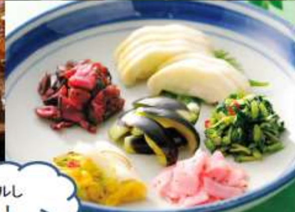
近江つけもの詰め合わせ