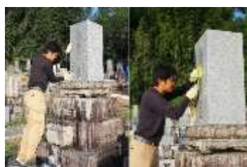
(お墓掃除サービス)