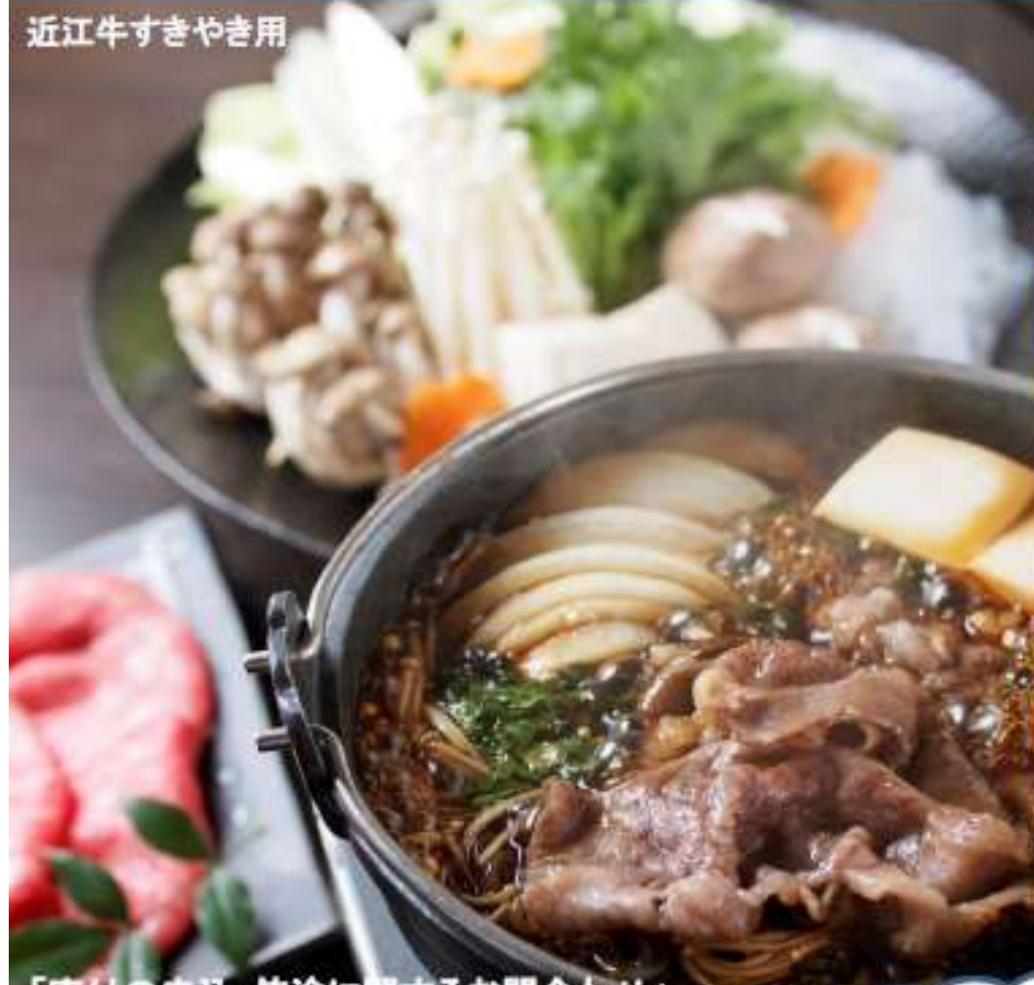
近江牛すきやき用