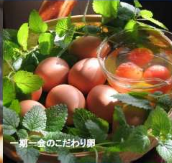
一期一会のこだわり卵

「寄付の申込・使途に関するお問い合わせ」 湖南省役所 総合政策部 地域創生推進課 〒520-3288 滋賀県湖南市中央一丁目1番地 TEL 0748-71-2316 / FAX 0748-72-2000