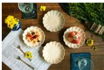
(輪花 銘々皿 4 枚組)

この返礼品は、本市でお墓掃除や空き家管理などを行う「こあき屋」を運営している、地域おこし協力隊の吉田健太郎氏が、地域の課題解決のために取り組んでいます。