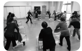
▲高齢者のサロン活動