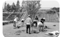
▲市民による公園の清掃活動