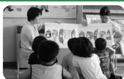
▲学校支援地域本部の活動