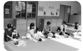
▲子育て支援センターの活動