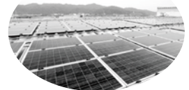
▲コナン市民共同発電所