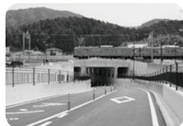
▲整備された市道三雲駅南線