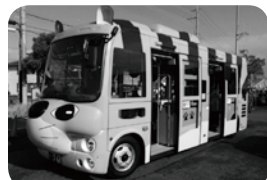
▲コミュニティバス「こにゃんバス」