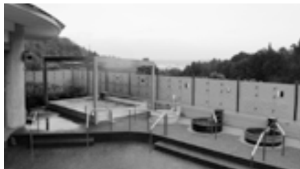
百伝の湯 露天風呂・壺風呂