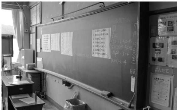
▲すっきり見やすい黒板、掲示物

市では本人や保護者と相談しながら、可能な範囲でその子どもにあった合理的配慮を提供しています。そして、内容は個別の指導計画に記載し、幼児期から就労期まで引き継いで支援しています。