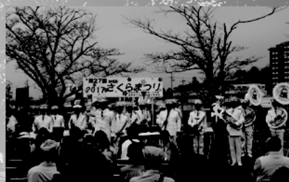
▲滋賀県警察音楽隊

また、会場周辺では、にじまつりも開催され、利用者によるステージ発表、模擬店などで賑わっていました。