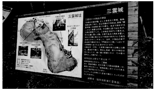
▲案内板が整備された三雲城址

また、サスケプロジェクトとして若者を中心にサスケに関する面白いことを企画・実施しています。興味のある人は聞へ。