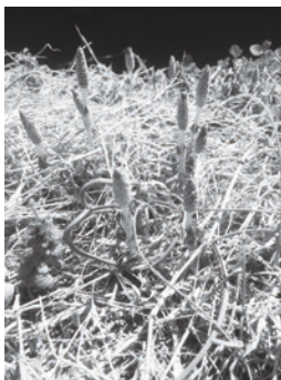
よく見たらあぜにつくしがいっぱい

毎年暖かくなってくると、いつも道端が気になります。おそらく自分の好きな食べ物ランキングで上位に食い込んでくるであろうもの…そう、それは「つくし」