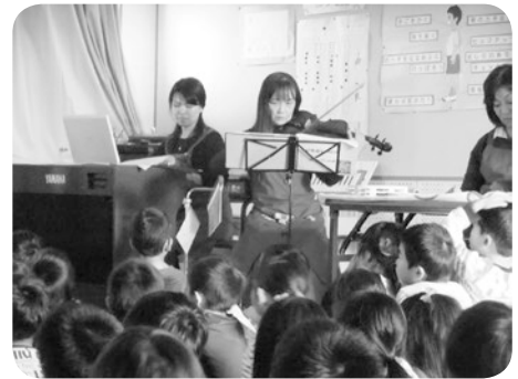
▲児童に大人気の「お話会」

教室の外に学習で使う図書が常に置かれ、日常的に教師や児童が学校図書館に足を運び授業を行っており、それに伴って子どもたちの読書冊数も増えています。また、図書館ボランティアが「朝の読み聞かせ」や「お話会」を定期的に行っています。音響やプロジェクターを使った「お話会」は常に児童で満員です。