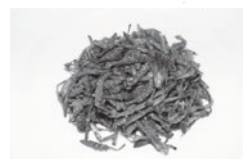
ほろ苦いつくしの佃煮

青い穂先が苦手なひともいるようですが、私はこのほろ苦い部分と茎の歯応えがなんとも好きです。食べたことのない方は一度、味わってみてはいかがでしょうか?