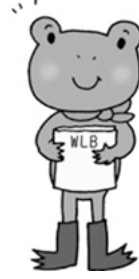
イラスト タカノ キョウコ

仕事、家庭生活、健康・休養、地域生活、勉強など人生にとって大切に行っていることが、希望するバランスで展開できるよう、自らのワーク・ライフ・バランスのあり方を考えてみませんか。