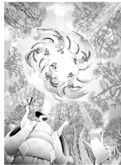
ウツクシマツ自生地へのアクセス