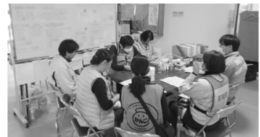
▲現地での打ち合わせの様子