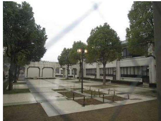
竜王西小学校 中庭の外灯LED化

■問い合わせ 担当課名:総合政策部 地域創生推進課 地域エネルギー室 担当者名:池本 (直通) 0748-71-2302 (FAX) 0748-72-2000 ※17時15分以降は、0748-72-1290までお問い合わせください。