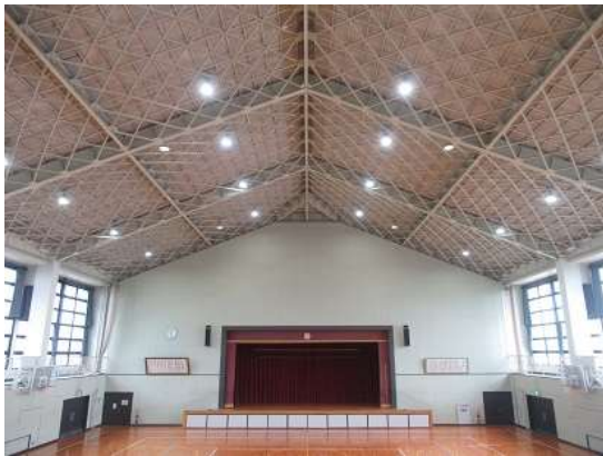
竜王西小学校 体育館のLED化