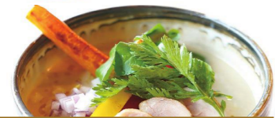
フレンチシェフが作る ベジタブルポタージュラーメン ¥980