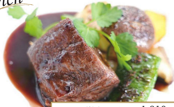
シェフのこだわりランチSET ¥1,810 (メイン肉or魚、スープ、サラダ、パン・ライス食べ放題、1ドリンク)

一部メニューがテイクアウトで登場! 外でもおうちでもおいしく召し 上がっていただけます