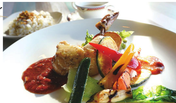
渾身のディナープレート ¥1,980 (ディナープレート、スープ、ライス)