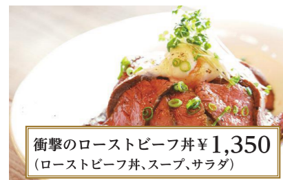
衝撃のローストビーフ丼 ¥1,350 (ローストビーフ丼、スープ、サラダ)