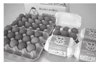
▲もみじ卵と平飼卵