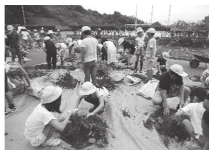
▲小学校でのサツマイモの収穫