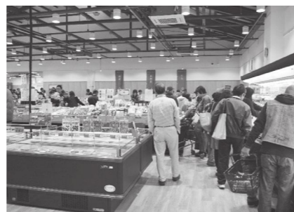
▲市民産業交流施設「ここぴあ」