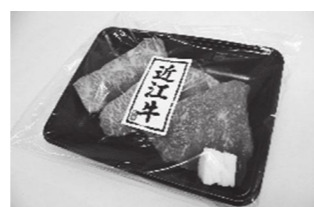
▲近江牛希少部位三種盛