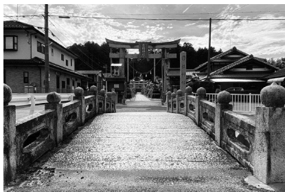
日枝神社▶ ■住所 下田3259番地

5月に行われる「お田植え祭り」では、色鮮やかな田植え衣装を着て化粧をした子どもたちが踊り、五穀豊穡を祈ります。参道の入口には明治45年に作られた立派な石橋があり、神社の本殿も堂々とした見事な造りです。日枝神社を訪れ、下田商店街の風情を感じながら街を歩いてみてはいかがでしょうか。