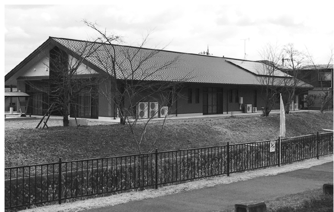
▲いしべ交流センターに設置した太陽光パネル