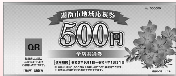
※湖南省地域応援券見本