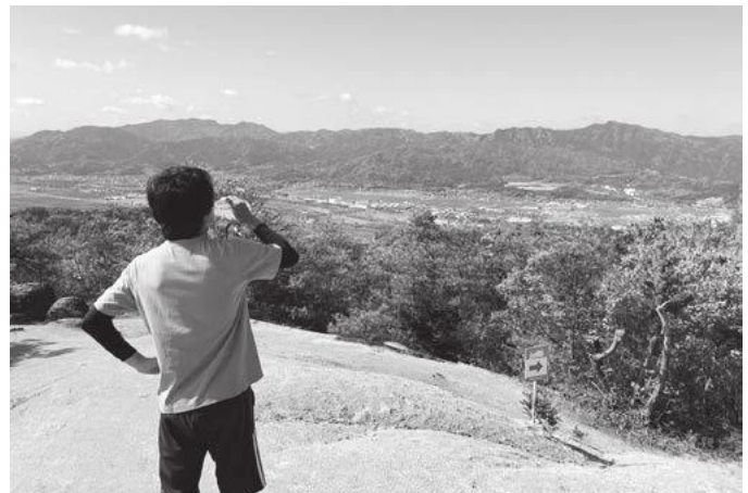
▲十二坊(岩根山)山頂