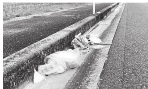
▲市道に投棄されたごみ